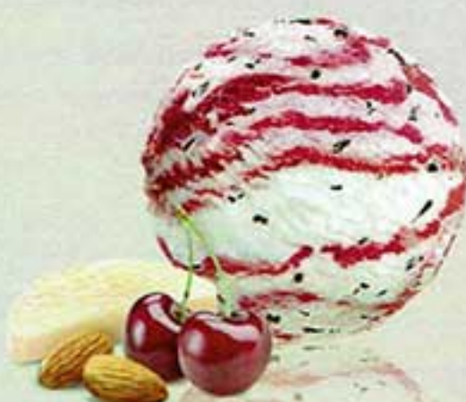
Marzipan - Sauerkirsche